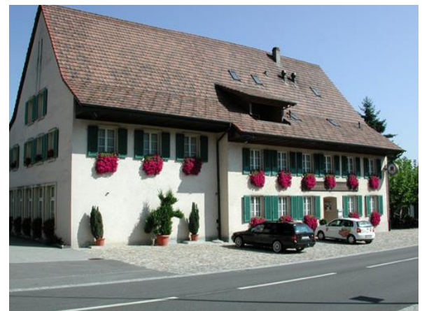
Gasthaus zum weissen Rössli