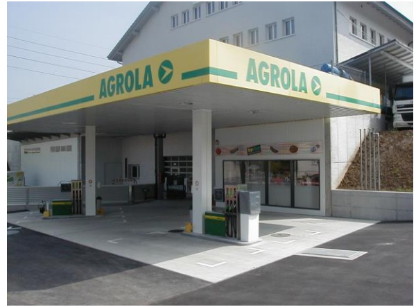
Agrola Tankstelle mit Shop