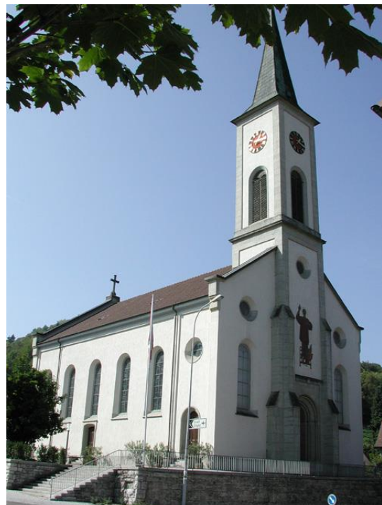
Röm.-kath. Kirche St. Vinzenz